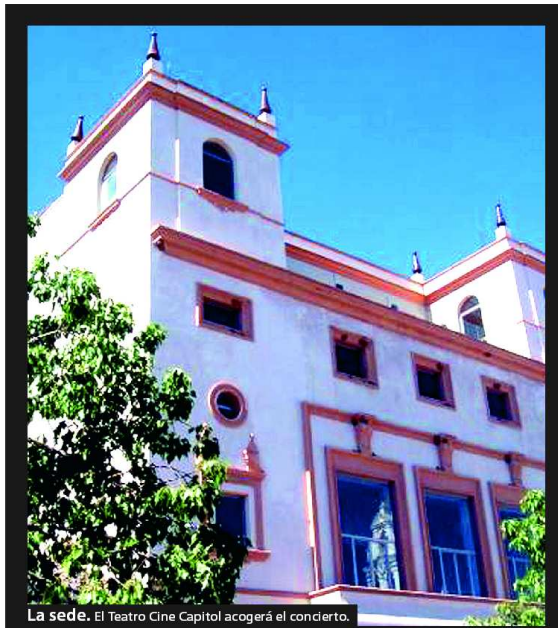
La sede. El Teatro Cine Capitol acogerá el concierto.

El día 28 de marzo el Centro Aprosuba 10 de Azuaga va a organizar la concentración eliminatória previa de JEDES para la zona sur II. Las modalidades que se van a disputar en esta concentración son las siguientes: petanca, tracción de cuerda, damas y fútbol. El lugar elegido para realizar las pruebas es el Parque Cervantes y la explanada de Fecsur. Todavía no está confirmada la asistencia de los distintos centros, pero la participación será similar a la de ediciones anteriores. Hay que recordar que Aprosuba es miembro fundador de los JEDES y que sus alumnos han participado en todas las ediciones.