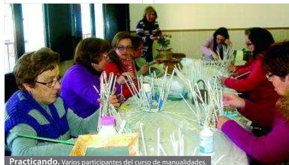
Practicando. Varios participantes del curso de manualidades.

Todas las actividades se desarrollan en las aulas de la Universidad Popular, que seguirá realizando acciones de este tipo para beneficio de las personas de la localidad.