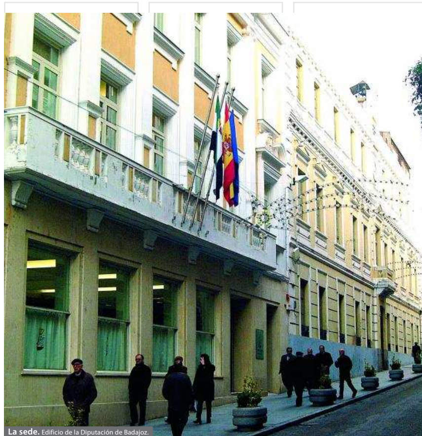
La sede. Edificio de la Diputación de Badajoz.

tralizadora que está siendo reforzada actualmente con la Red Provincial de Observatorios Territoriales que tienen el objetivo de proporcionar una gestión local estructurada y coordinada en varios niveles: el administrativo, la sociedad civil a través de asociaciones y organizaciones representativas del territorio, el socioeconómico y el ámbito de gestión técnica en materia de desarrollo local.