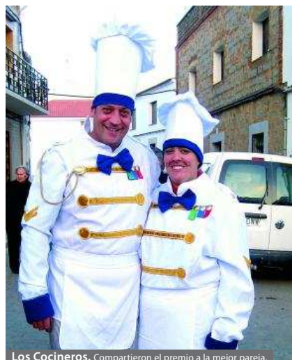
Los Cocineros. Compartieron el premio a la mejor pareja.