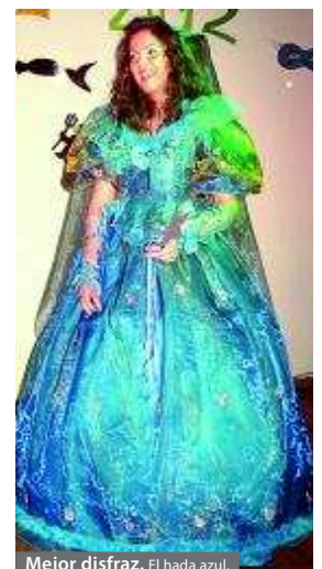
Mejor disfraz. El hada azul.