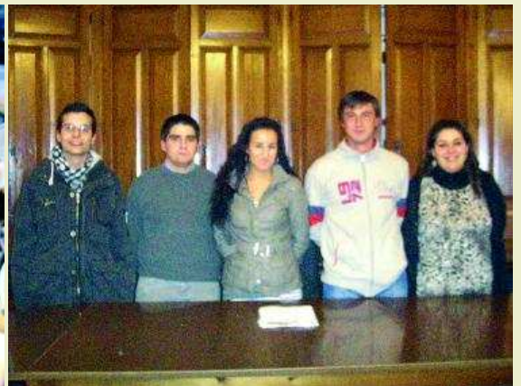
Algunos miembros de la asociación 'El Olmo'. El pasado día 10 de febrero se reunió la directiva de la asociación Juvenil 'El Olmo' de Maguilla con la A.E.D.L. del Ayuntamiento para ultimar detalles e inscribirse en el Registro de Asociaciones Juveniles de Extremadura.