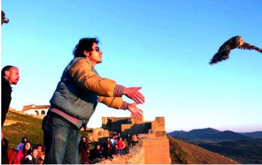
A volar. Uno de los participantes en la actividad echa al aire una de las aves rapaces.