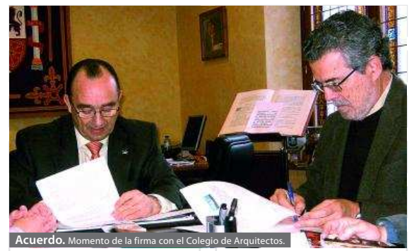
Acuerdo. Momento de la firma con el Colegio de Arquitectos.

La firma se produjo el pasado 26 de enero, cuando se redactó un convenio de colaboración entre el Ayuntamiento de Llerena y el Colegio de Arquitectos de Extremadura. Según el texto, se establece el reconocimiento del informe de visado del Colegio como motiva-