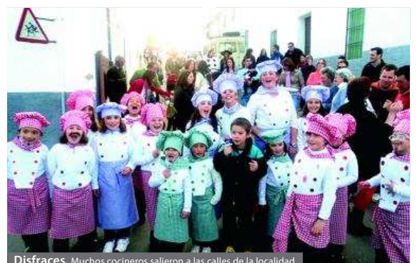
Disfraces. Muchos cocineros salieron a las calles de la localidad.

La verbena del sábado de carnaval fue amenizada por pinchadiscos Faly.