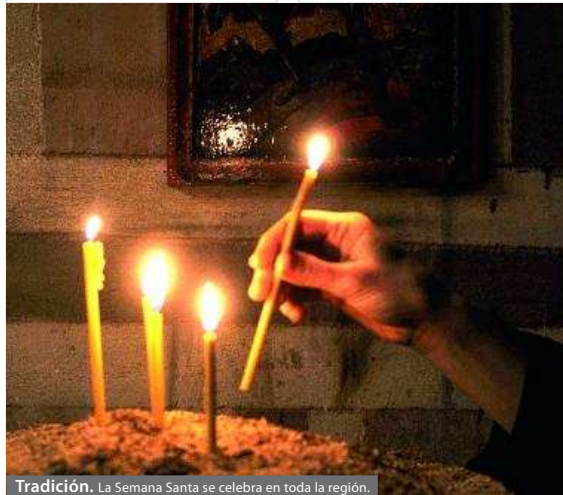
Tradición. La Semana Santa se celebra en toda la región.

Tras el pregón habrá un concierto de marchas procesionales