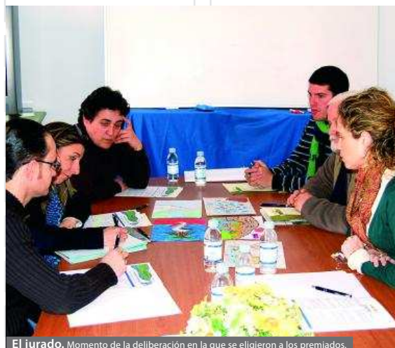
El jurado. Momento de la deliberación en la que se eligieron a los premiados.

tutos de la comarca y tuvieron como fecha límite para presentar los trabajos el 24 de enero. En total se recibieron 103 dibujos de los centros: C.E.I.P. San Benito Abad de Peraleda del Zaucejo; Colegio Nuestra Señora de la Granada-Santo Ángel, de Llerena; C.E.I.P. Alcalde Paco de la Gala, de Granja de Torrehermosa;