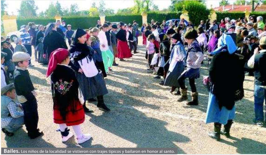
Bailes. Los niños de la localidad se vistieron con trajes típicos y bailaron en honor al santo.

GRANJA DE TORREHERMOSA La feria que tradicionalmente tenía lugar en la localidad volvió a celebrarse en 2012