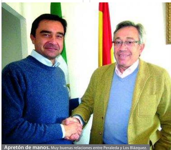
Apretón de manos. Muy buenas relaciones entre Peraleda y Los Blázquez.

pasado mes de febrero para intercambiar impresiones sobre posibles decisiones que pueden ser tomadas en beneficio de los