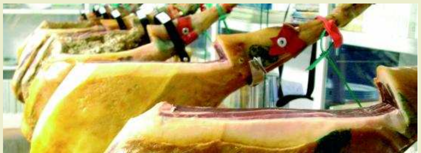
Jamones. Los productos relacionados con el cerdo son los más solicitados por los turistas que llegan a Badajoz.

Las provincias incluidas son: Córdoba, Huelva, Cáceres, Badajoz y Salamanca. Cuatro Denominaciones de Origen, Dehesa de Extremadura, Sierra de Huelva, Guijuelo y Los Pedroches, están implicadas en el proyecto, del que también participan 20 grupos de acción local y 411 municipios. A disfrutar del jamón.