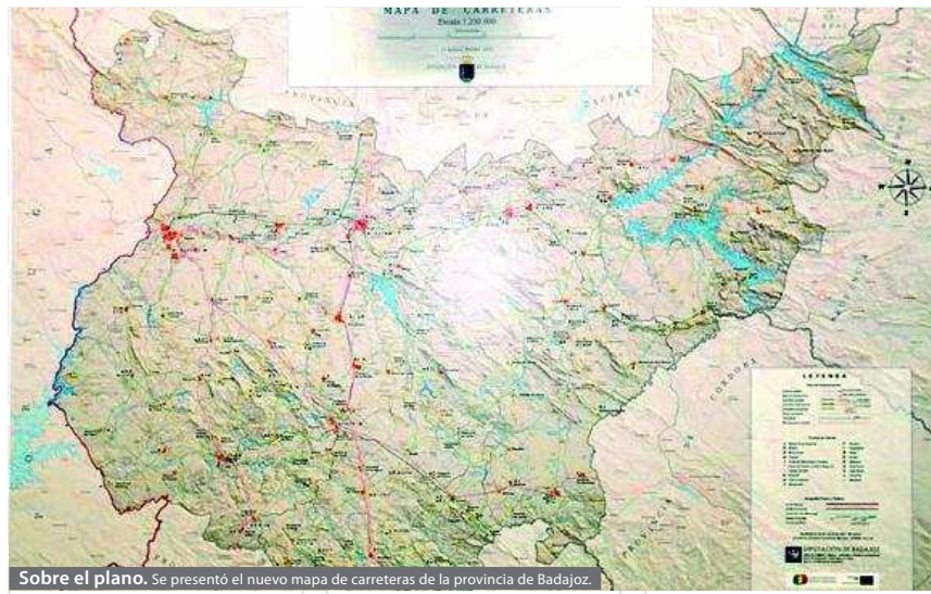
Sobre el plano. Se presentó el nuevo mapa de carreteras de la provincia de Badajoz.