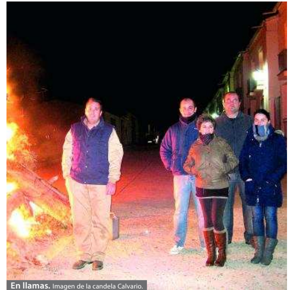
En llamas. Imagen de la candela Calvario.

En la jornada del lunes se despidió el Carnaval 2012 con el entierro de doña Sardina y la entrega de los premios a las comparsas ganadoras. Después continuó la fiesta y la comida con las sardinas asadas que ofreció el Ayuntamiento a todos los asistentes, ya fueran vecinos de Retamal o visitantes.