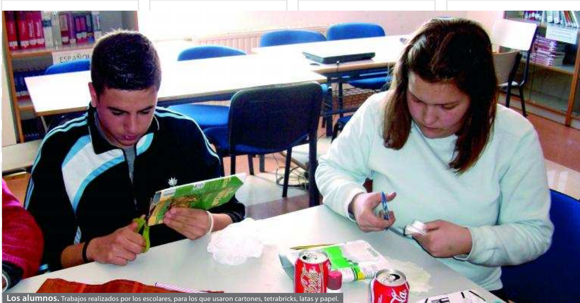
Los alumnos. Trabajos realizados por los escolares, para los que usaron cartones, tetrabricks, latas y papel.

con material reciclado, como ambientadores naturales, ceniceros, marcos de fotos o monederos. Para ello utilizaron cartón, tetrabrick, papel, plástico y otros materiales.