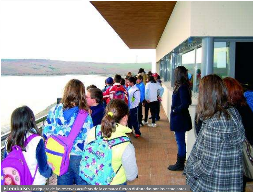
El embalse. La riqueza de las reservas acuíferas de la comarca fueron disfrutadas por los estudiantes.

OBJETIVO Aproximar a los jóvenes los valores naturales, culturales y artísticos de la zona