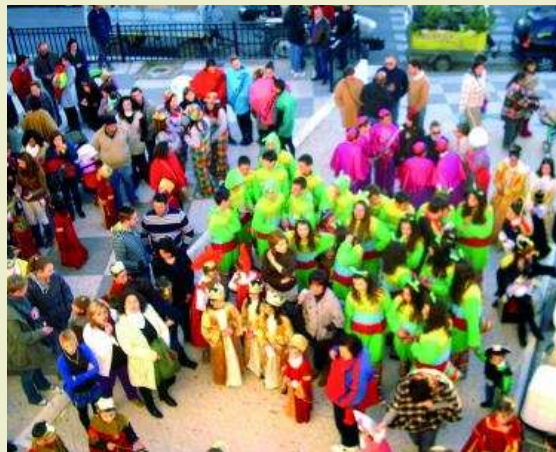
Fiesta en la calle. La participación ciudadana fue muy destacada.

El domingo se celebró en la Plaza del Ayuntamiento el desfile de disfraces y carrozas. Pero, no fue el fin de las fiestas. Quedaban dos días de carnavales el tan conocido día del Mamarracho que es el sábado 25 y el entierro de las sardina, el domingo 26.