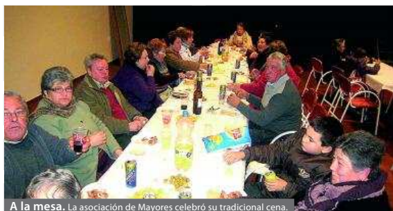
A la mesa. La asociación de Mayores celebró su tradicional cena.

El característico baile de la asociación de Mayores cerró la fiesta.