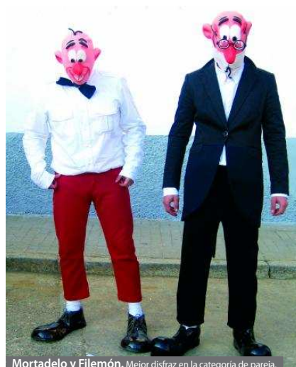
Mortadelo y Filemón. Mejor disfraz en la categoría de pareja.