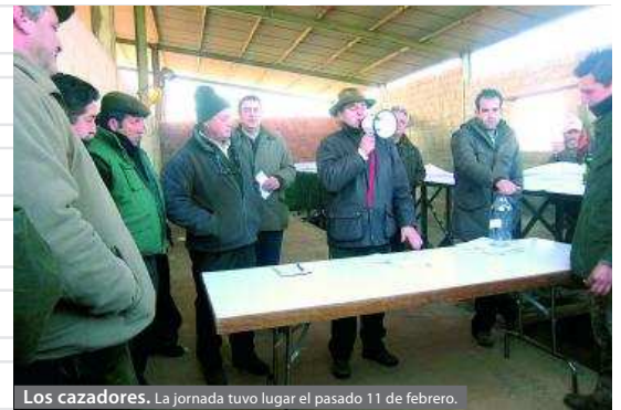
Los cazadores. La jornada tuvo lugar el pasado 11 de febrero.