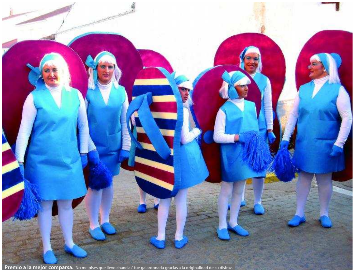
Premio a la mejor comparsa. 'No me pises que llevo chanclas' fue galardonada gracias a la originalidad de su disfraz.

Como en tantas otras localidades, los actos del Carnaval comenzaron en el colegio. Los niños celebraron una actividad con el tema ' Los