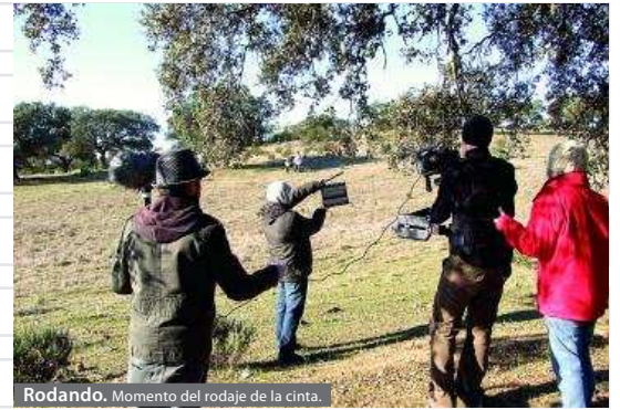
Rodando. Momento del rodaje de la cinta.

Las marchas procesionales son uno de los fenómenos musicales más importantes dentro de la Semana Santa y constituyen un género que en los últimos años está rebasando las fronteras nacionales e internacionales.