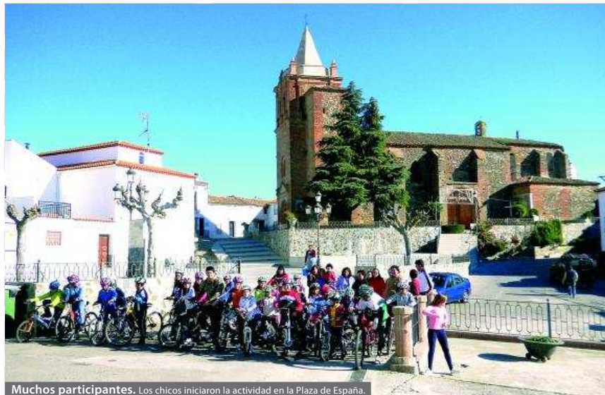
Muchos participantes. Los chicos iniciaron la actividad en la Plaza de España.

Los participantes acabaron dicho recorrido en la pista polideportiva. Allí recibieron fruta y zumo y continuaron con una ginkana de habilidad con diferentes pruebas en las que probaron su destreza sobre la bicicleta. Luego hubo una carrera lenta, en la que el ganador era el último que llegaba a la meta