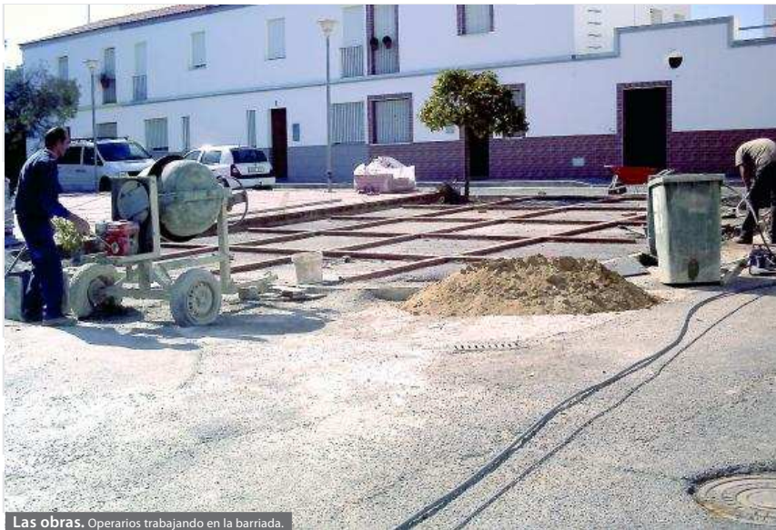
Las obras. Operarios trabajando en la barriada.