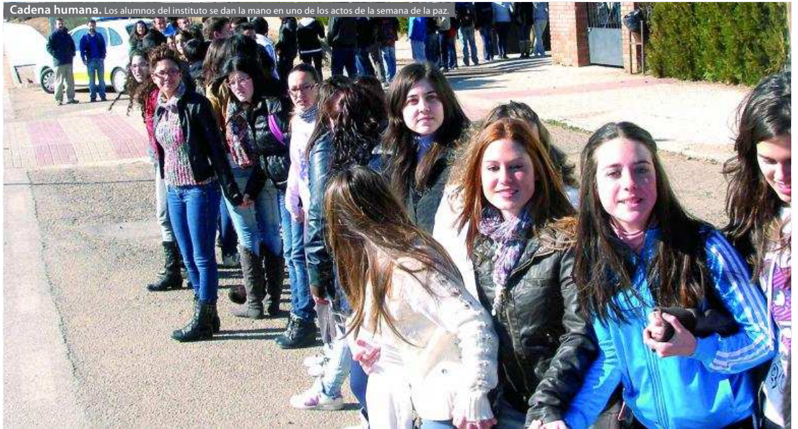
Cadena humana. Los alumnos del instituto se dan la mano en uno de los actos de la semana de la paz.

EFEMÉRIDES La celebración coincide con el aniversario de la muerte de Mahatma Gandhi, una de las personas que más trabajó por la paz en el mundo