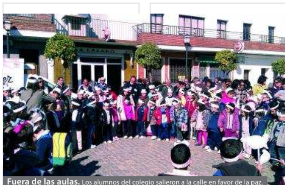
Fuera de las aulas. Los alumnos del colegio salieron a la calle en favor de la paz.

J.M.M. El día 31 de enero, se celebra el día de la Paz y la No violencia. La elección de esta fecha se realiza para conmemorar la muerte de Mahatma Gandhi, que falleció el 30 de enero de 1948.