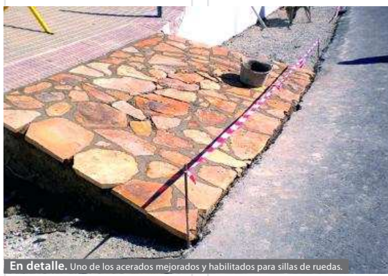
En detalle. Uno de los Acerados mejorados y habilitados para sillas de ruedas.

Las mejoras se están realizando en los Acerados y la pavimentación de la vía. El año pasado se acometió el proyecto más ambicioso en cuanto a reformas y ejecución en el tramo que comprendía desde el inicio de la avenida hasta el cruce con la calle Robledo. En el proyecto aprobado para este año habrá una continuación de lo ya ejecutado, los pavimentos y Acerados, la eliminación de vegetación, la instalación de nuevas redes de saneamiento, abastecimiento e iluminación, en el tramo que comprende las calles Robledo, Dónoso Cortés, Nuñez de Balboa y Divino Morales.