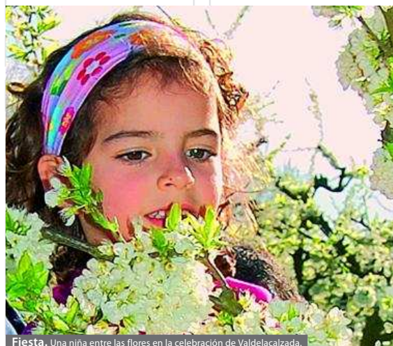
Fiesta. Una niña entre las flores en la celebración de Valdelacalzada.

REDACCIÓN. Desde el pasado 26 de febrero y hasta el 18 de marzo, la localidad pacense de Valdelacalzada celebra la novena edición de su fiesta de las flores. 'Valdelacalzada en flor' invita a paisanos y forasteros a disfrutar con el espectáculo de los frutales floridos, un paisaje que en unos quince días alcanzará todo su esplendor.