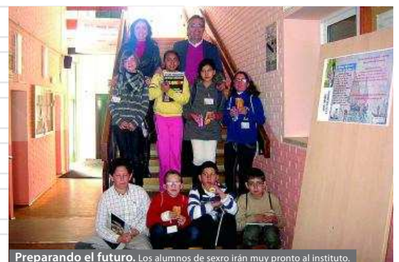
Preparando el futuro. Los alumnos de sexto irán muy pronto al instituto.

La visita finalizó con un aperitivo y con un rato de animada charla entre alumnos del instituto y del colegio. Estos últimos aprovecharon para saciar su curiosidad y realizaron muchas preguntas a los mayores.