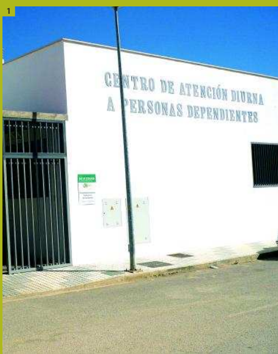
1. Vista exterior de las instalaciones de Afenad. 2. La sala de fisioterapia del centro Aprosuba 10. 3. Miembros de Alucod trabajando en la sala de reciclado. 4. Exterior del centro Aprosuba 10. 5. Actuación de los responsables de A.F.E.C.C.

En 2012 se han planificado varias actuaciones, campañas de difusión y prevención, cursos de voluntariado, captación de socios, campañas de sensibilización y ciclos de conferencias.