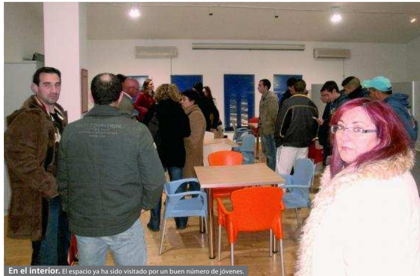
En el interior. El espacio ya ha sido visitado por un buen número de jóvenes.

El acto oficial se produjo el 3 de febrero y asistieron muchos jóvenes