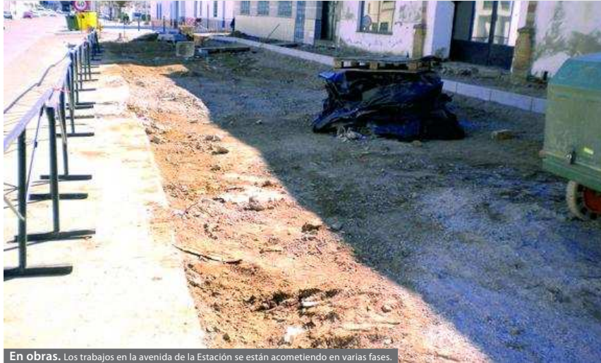
En obras. Los trabajos en la avenida de la Estación se están acometiendo en varias fases.

Por su parte, también se están realizando trabajos en la Avenida de la Estación de la localidad. En este caso, y debido a la longitud de la avenida, las obras que se efectúan se están llevando a cabo en diferentes fases. Esto se realiza así para poder ir terminando unos tramos antes de empezar otros y, de esta forma, ocasionar las menos molestias posibles a los vecinos.