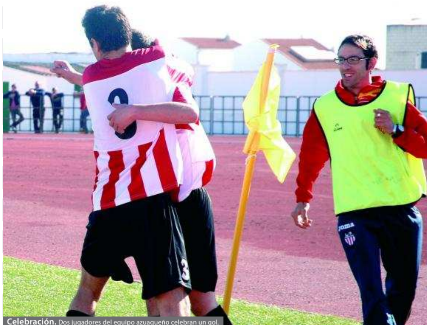
Celebración. Dos jugadores del equipo azuaguense celebran un gol.

REDACCIÓN. No ha sido el mejor mes de la temporada para el CD Azuaga.