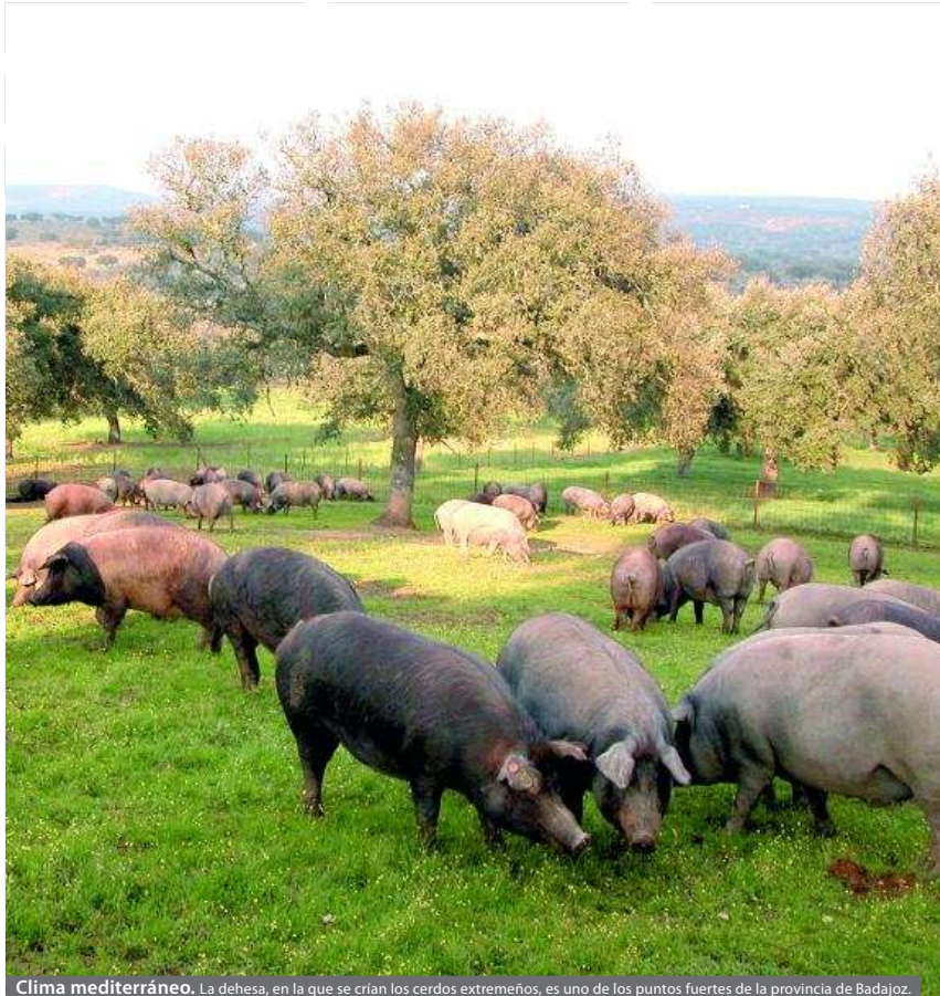
Clima mediterráneo. La dehesa, en la que se crían los cerdos extremeños, es uno de los puntos fuertes de la provincia de Badajoz.

recursos turísticos que hay alrededor del toro. Otra de las apuestas del Patronato Provincial es crear la marca 'Dehesa y Toro'. Fruto de esta iniciativa es la guía sobre ganaderías y recursos turísticos de la que habló Cortés. «La guía se seguirá ampliando una vez concluidos los acuerdos con em-