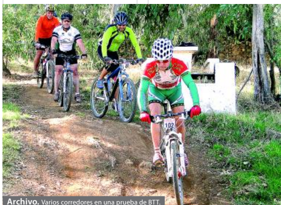
Varios corredores en una prueba de BTT.

REDACCIÓN. La IX Marcha en Bicicleta de Montaña 'Fernando Torres Martín', organizada por la Agrupación Cicloturista de Llerena, se celebra el domingo 4 de marzo. Esta prueba está incluida en los circuitos de cicloturismo regional y nacional, siendo puntuable para la V Ronda Cicloturista de BTT y para Circuito de España de BTT.