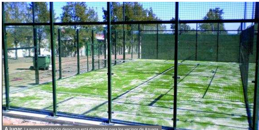
A jugar. La nueva instalación deportiva está disponible para los vecinos de Azuaga.

En el recinto de la piscina municipal se ha construido una nueva pista de pádel. La nueva instalación está dotada con las características más novedosas y modernas en el sector. Tanto es cristal que recubre toda la estructura, elemento indispensable en la cons-