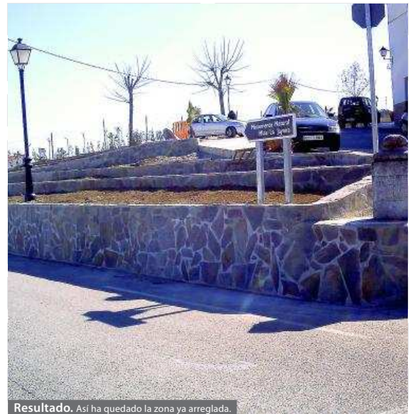
Resultado. Así ha quedado la zona ya arreglada.