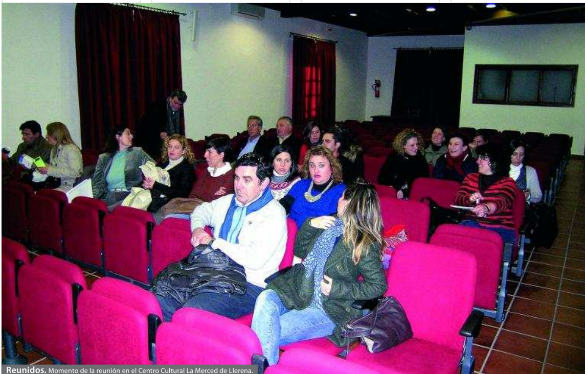
Reunidos. Momento de la reunión en el Centro Cultural La Merced de Llerena.

Esta iniciativa está programada por el Área de Igualdad y Desarrollo Local de la Diputación de Badajoz y se encuadra dentro del proyecto 'Red de Observatorios Territoriales'. La cual está subvencionada en un 70 por ciento por los fondos FEDER, destinados a proyectos de Desarrollo Sostenible, Local y Urbano para pequeños y medianos municipios.