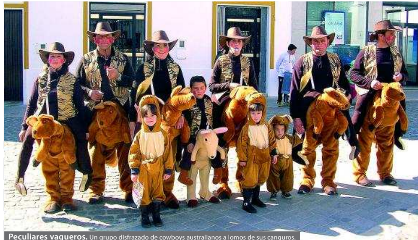
Peculiares vaqueros. Un grupo disfrazado de cowboys australianos a lomos de sus canguros.

Disfraces los hubo de todo tipo, tribus africanas, simpáticas chicas 'conguito', hadas, mariposas, divertidos australianos a lomos de su canguro, Minies, el Tío de la Vara, conseguidos robots de animación, inocentes tigresas, la guardia real inglesa y hasta alguna Shakira resultona y sobrada de michelines. Todo cabía en este soleado domingo de carnaval.